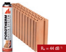
Porotherm 11,5 AKU Profi