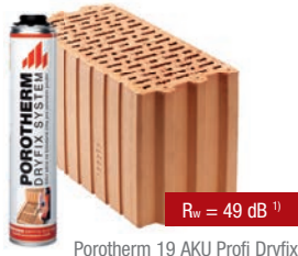
Porotherm 19 AKU Profi